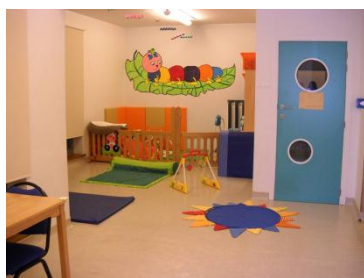
«Les Chenilles »

Notre crèche comporte deux sections, celle des bébés « Les Chenilles » (+/- avant 18 mois) et celle des plus grands « Les Papillons » (+/- après 18 mois).