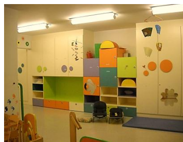
«Les Papillons »

Les deux groupes d'enfants et les sections sont aménagés en fonction de l'âge et de l'évolution des enfants accueillis dans notre crèche.