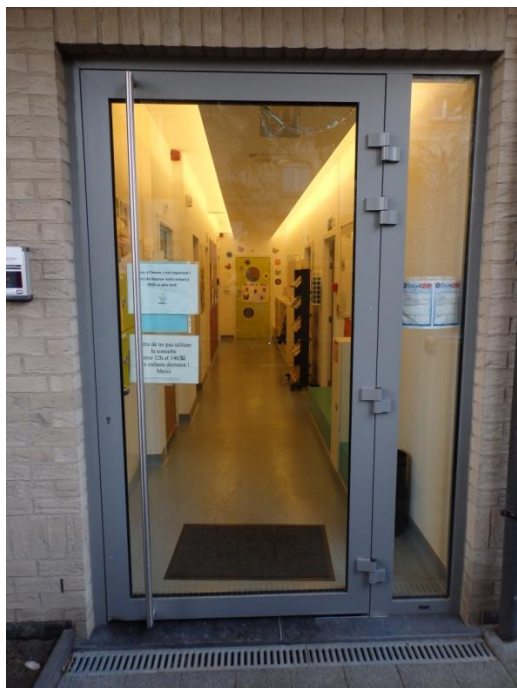
Entrée de la crèche

Lorsque vous entrez dans notre crèche, vous serez accueillis dans le corridor principal où se trouvent les casiers et portemanteaux de votre enfant. A votre gauche se situe la section des Chenilles et à votre droite, le bureau des responsables. Sur ce mur, vous retrouvez le tableau d'information ainsi que le menu de la semaine. Un peu plus loin, à gauche, vous trouvez le local à poussettes. Au fond du couloir se trouve la section des Papillons.