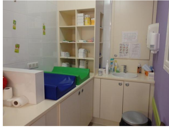
La salle de bain de la section des Chenilles