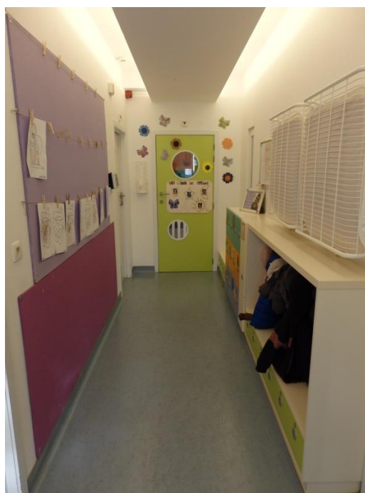
Entrée de la section des plus grands Casiers, tables à langer et panneau d'affichage