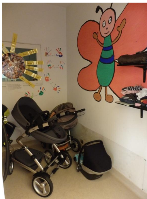
Local à poussettes