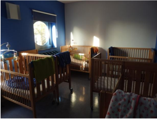
La chambre de la section des Chenilles