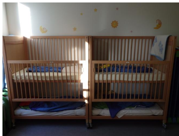
La chambre de la section des Papillons: lits hamac et lits à barreaux