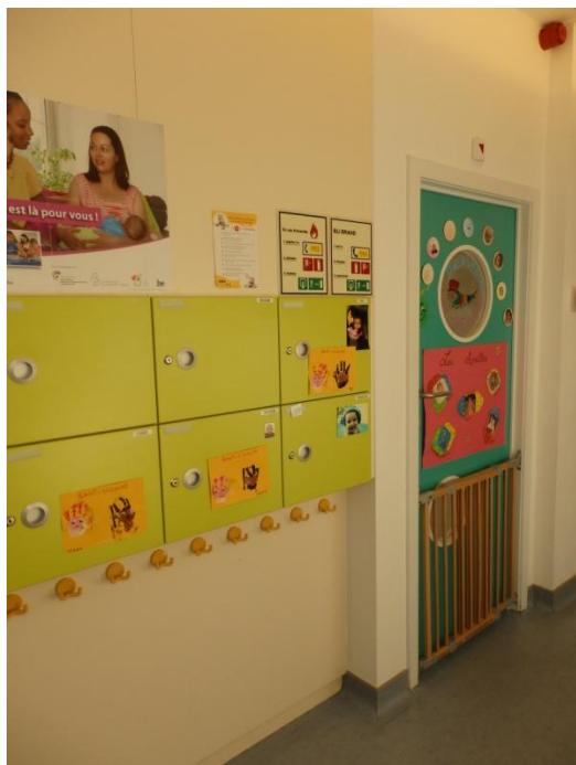
Entrée et casiers des plus petits