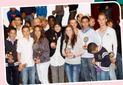
Karatéclub Le Chardon