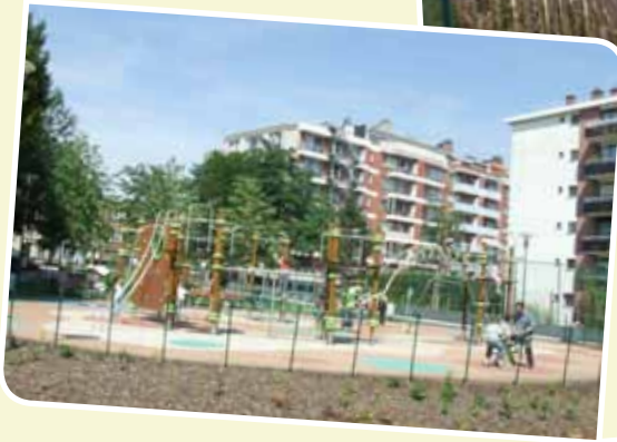
De Mulderpark (Josse Goffinlaan)