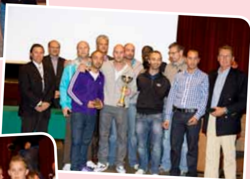
De zaalvoetbalploeg Bardots Berchem