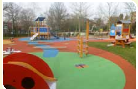
Pirsoulpark (Koning Albertlaan/Bloemkwekersstraat)