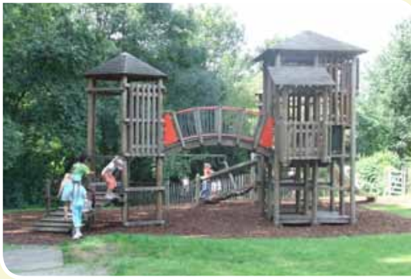
Wilderbos (ingang Groendreefstraat)