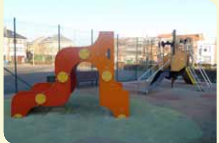
't Hof te Overbeke (August Deniestraat)