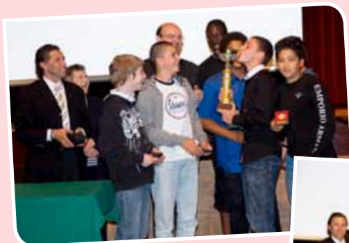
De knapen van Berchem Basketball Club