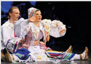
Wit-Rusland / Biélorussie

MATINEE 15:00 05, 07, 08 & 09 juni / juin 2016 SOIREE 20:00