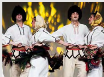
Servië / Serbie