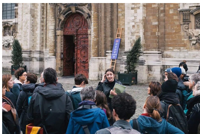
Bezoek aan het begijnhof van Brussel, VZW L'architecture qui dégenre