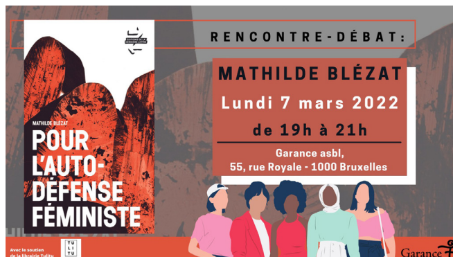
GARANCE-brochure, lezing debatt