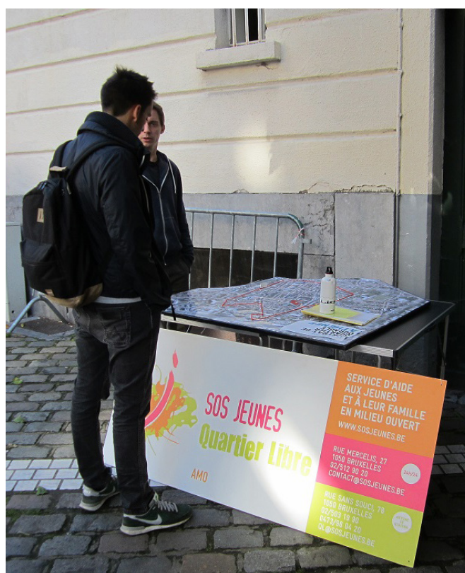
SOS Jeunes - Quartier Libre AMO, DWC Atheneum, Elsene