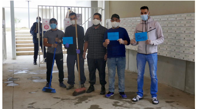
Collectieve inzameling, ER-project in Central Gardens, Anderlecht