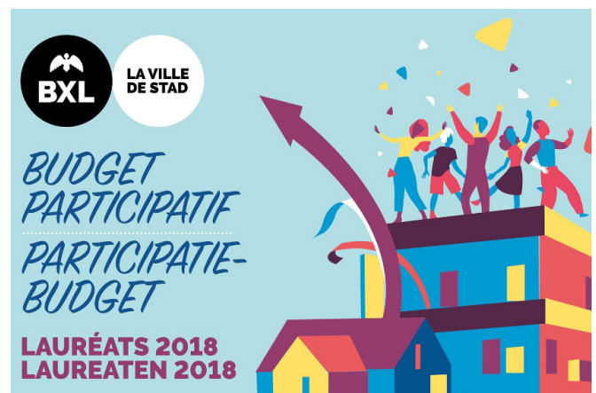
Participatief budget Stad Brussel, 2018