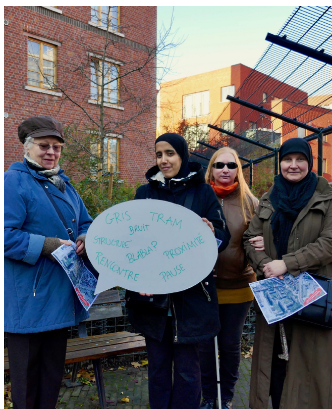
Vertelwandeling onder vrouwen, ERU voor DWC Magritte