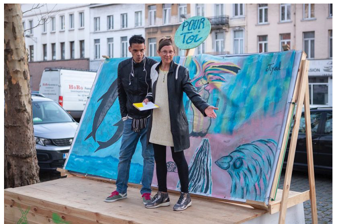
On~de Senne, Constructlab en Atelier Made, Poincarélaan