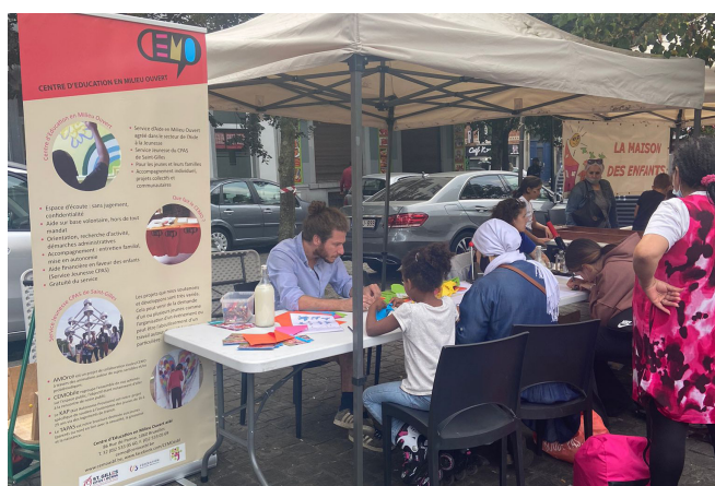
CEMO Sint-Gillis, Moricharplein