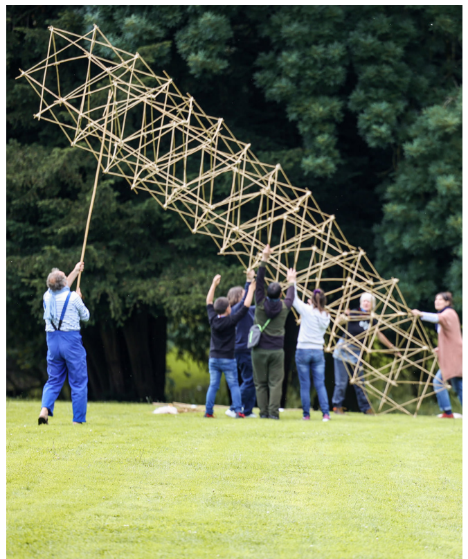
Buitenkunstinstantie, Patrimoine à roulettes