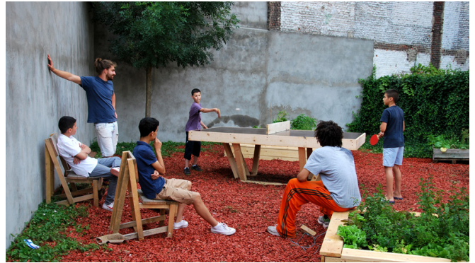
Collectif Etc, Le Détour de France, Brussel