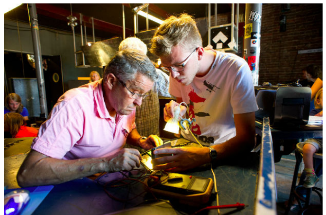
Repair Café, Recyclart, Brussel