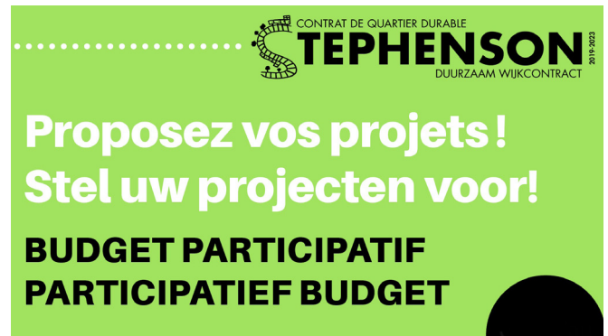
Promotie participatief budget DWC Stephenson, 2019