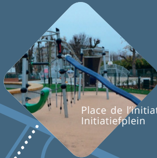
Place de l'Initiative Initiatiefplein