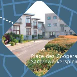
Place des Coopérateurs Samenwerkersplein