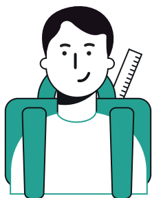
ABORDS DES ÉCOLES SCHOOLOMGEVINGEN