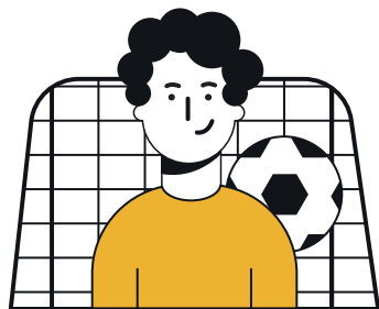
TERRAINS DE SPORT SPORTTERREINEN